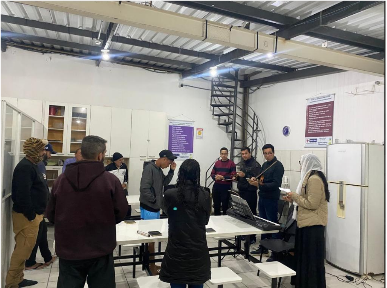
Figura 6: Congregação no Albergue – 25/07/2025