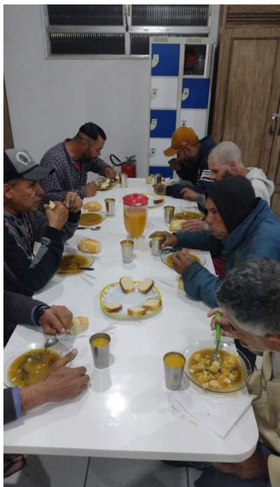
Figura 3: Lanche da Noite, 11/07/2025