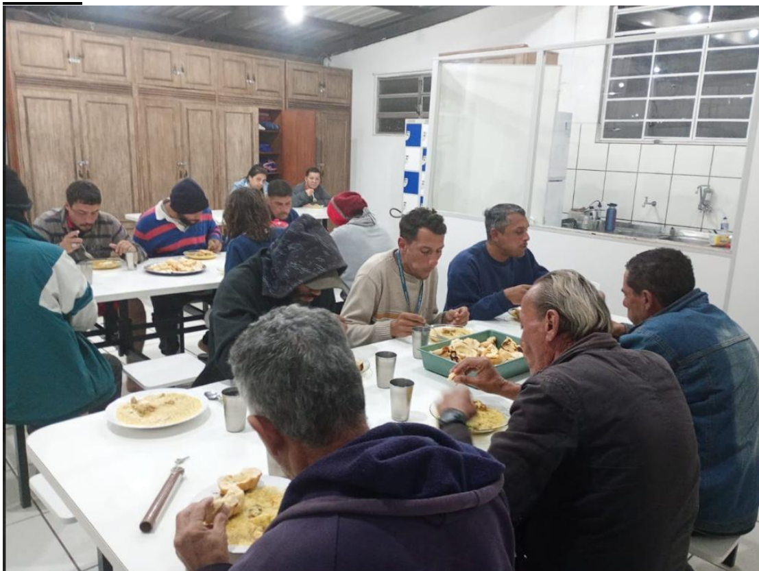
Figura 1: Noite da Sopa – 09/07/2025