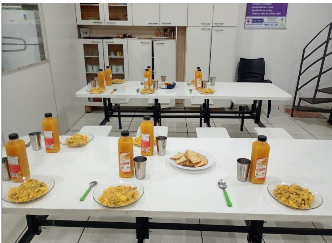
Figura 4: Lanche da Noite, 11/07/2025