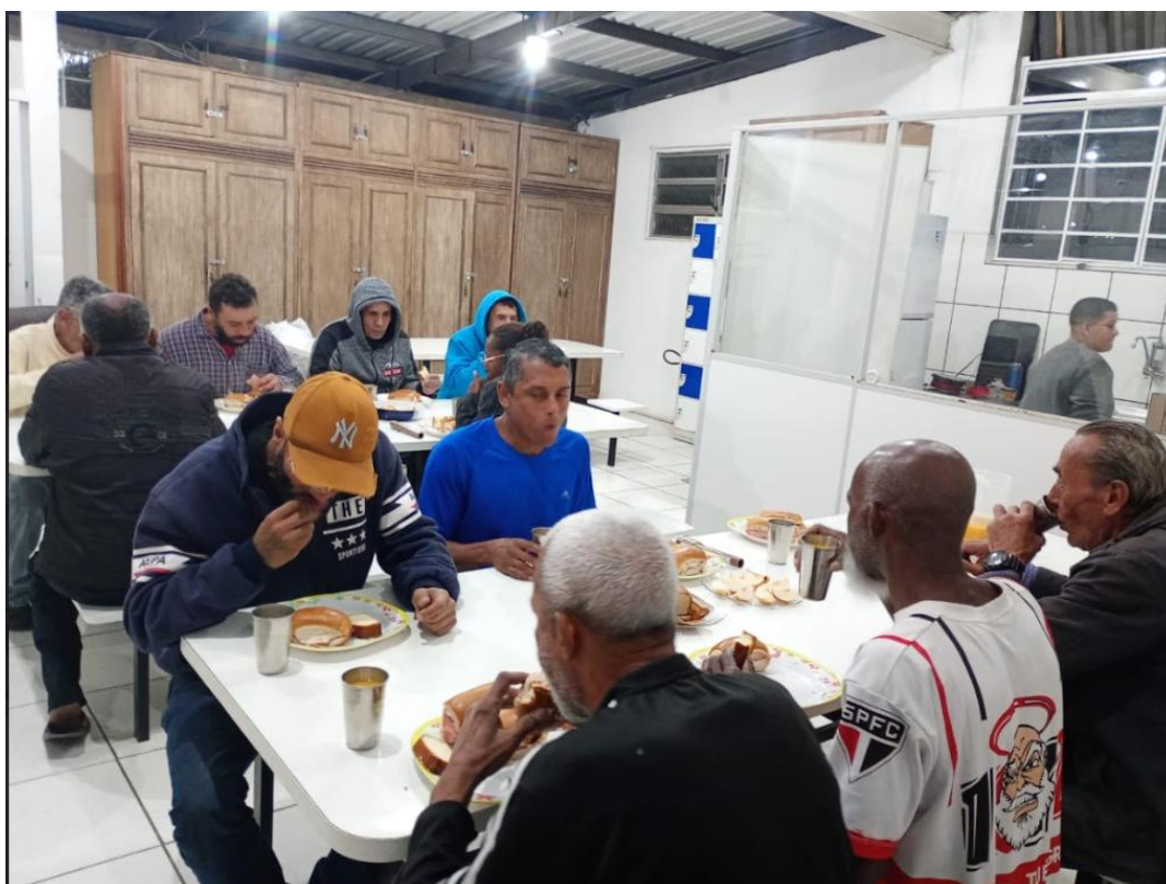
Figura 5: Lanche da Noite, 15/07/2025