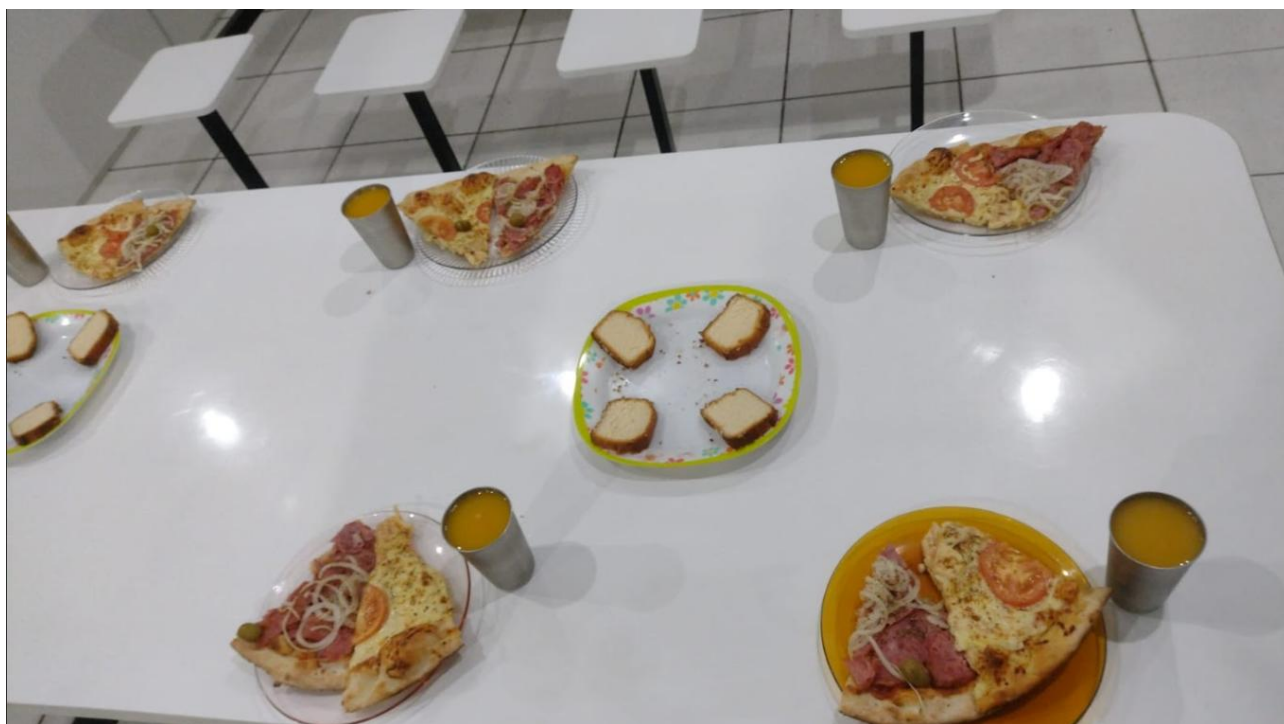
Figura 2: Noite da Pizza 10/07/2025